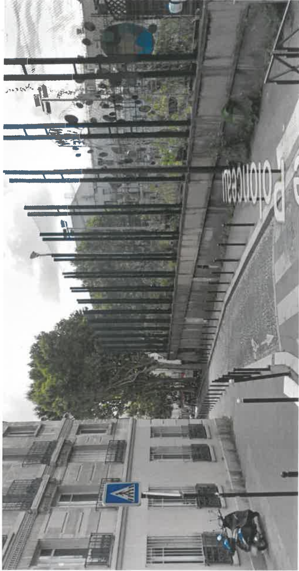
Vue de la rue Polonceau (ouest)